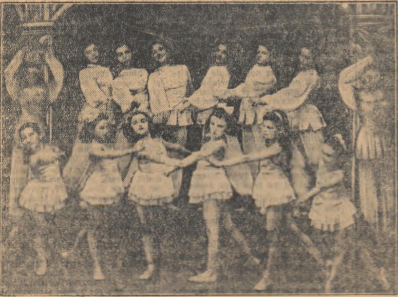
Aspect de la spectacolul „Floarea purpură“ prezentat de colectivul artistic al Casei de cultură „A. S. Pechin“ din Oradea.