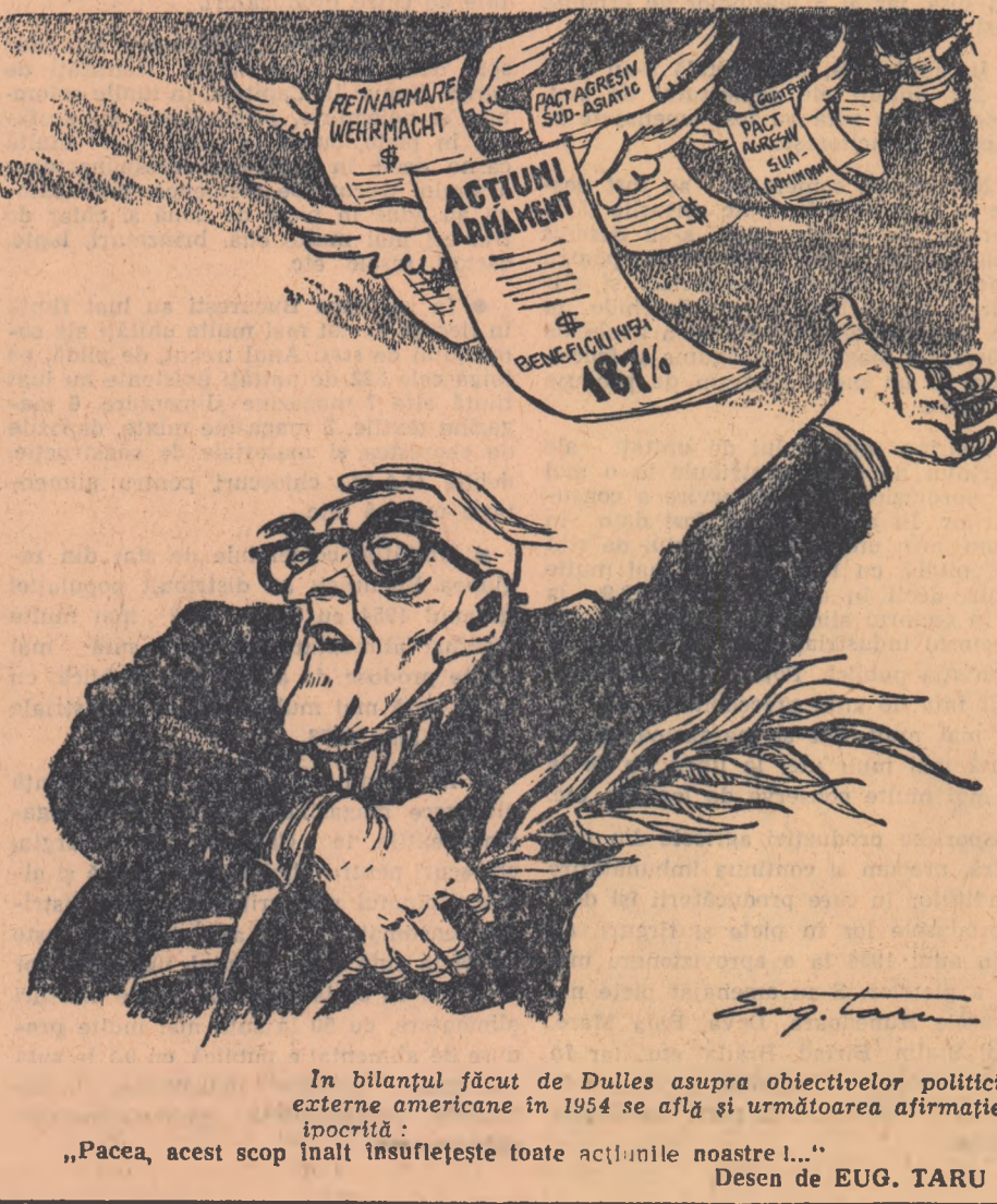
„Pacea, acest scop înalt însuflește toate acțiunile noastre...“ Desen de EUG. TARU