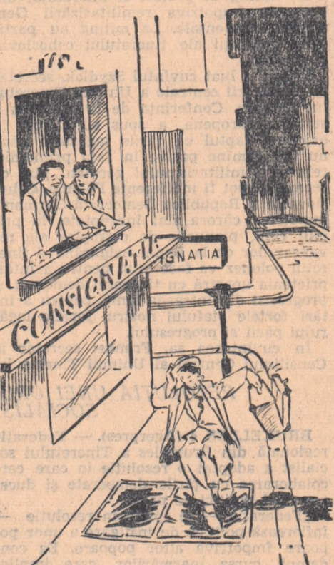
— Așa, se vede, că-i străm. Nu cunoaște... „obiceiurile pământului“...

De mult timp, circulația pietonilor de pe trotuarul din fața magazinului „Constanța“ din Plocești a devenit anevoioasă și plină de... riscuri. Acestea din cauza celor două luminatoare al subsolului magazinului, care au răscolit distruge și geamurile sparte. Deși au fost sezișate, organele de resort ale statului popular orășenesc nu au luat nici o măsură pînă în prezent.