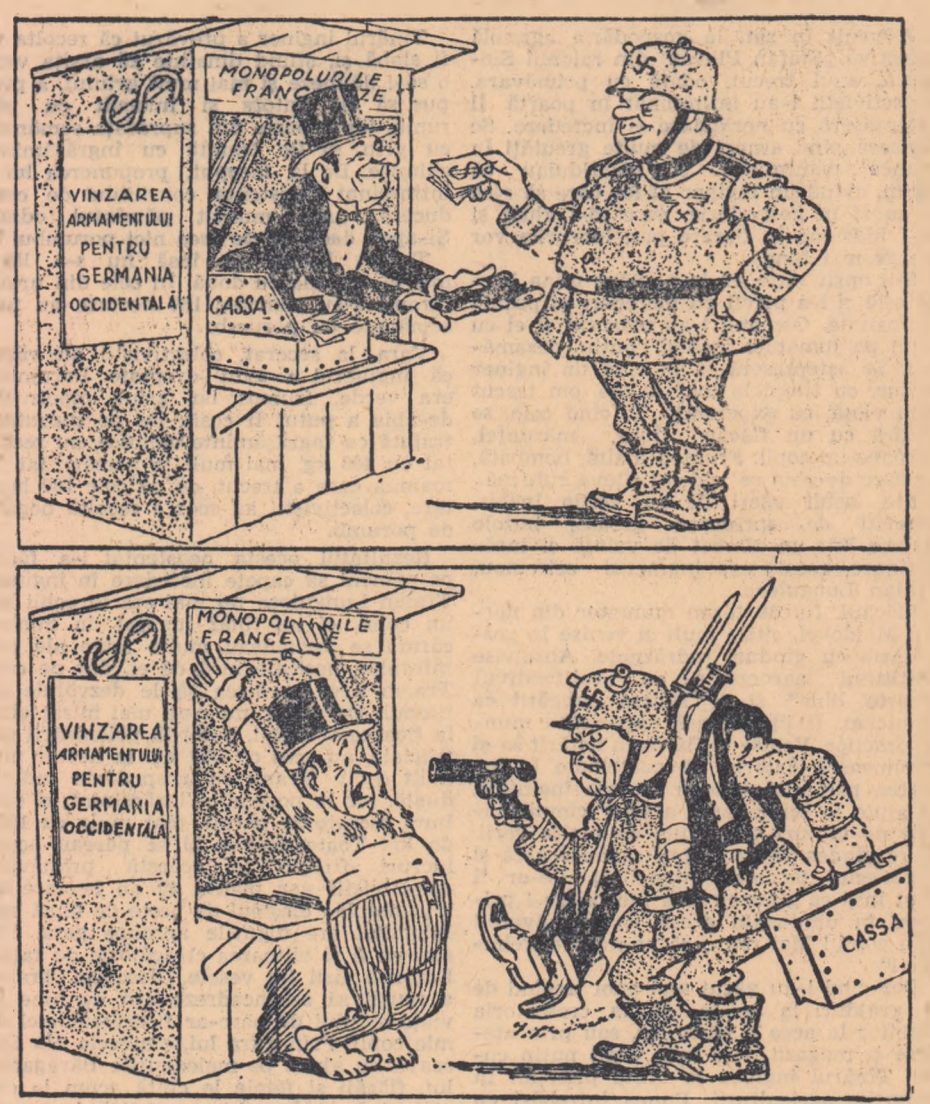
Desen de D. TINOVSKI

Monopolștii francezi, sprijinînd refacerea Wehrmachtului contează pe obținerea unor mari profituri în contul livrării de armament pentru Germania occidentală.