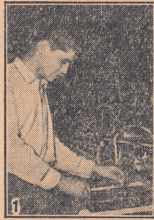
1. În magazinul I.C.S. universal „Victoria” din București a intrat un tinăr și grăbit s-a adresat vânzătoarei: — Vă rog, o pereche de ciorapi Kapron, calitate I-A.

Vînzătoarea l-a întins un plic ce conținea ciorapi cu marca cerută. Cu pachetul în mînă tinărul a pornit volos să-l ducă soșel în dar de ziua ei. În magazin au mai venit cumpărători și au cerut să cumpere același ciorapi.