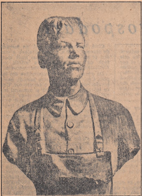
„Fruntă în producție” de DUMITRU CĂILEANU — gips

Privind felul cum se prezintă tineretul în actuala expoziție, ne vom opri înțit la unele exemple mai caracteristice din creațiile absolvenților sau studenților institutelor de artă plastică.