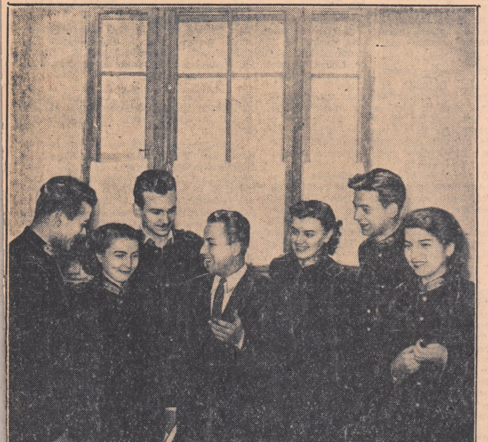
Ieri dimineață, în toate facultățile și Institutele de învățămînt superior au reînceput cursurile. După o vacanță odihnitoare, studenții s-au înapoiat la locurile lor de muncă, cu forțe proaspete, cu hotărîrea de a desfășura pe mal departe procesul de învățare în condiții tot mai satisfăcătoare.

Tinerii sportivi ai satelor, participați la întrecerile Spartachiadei de iarnă!