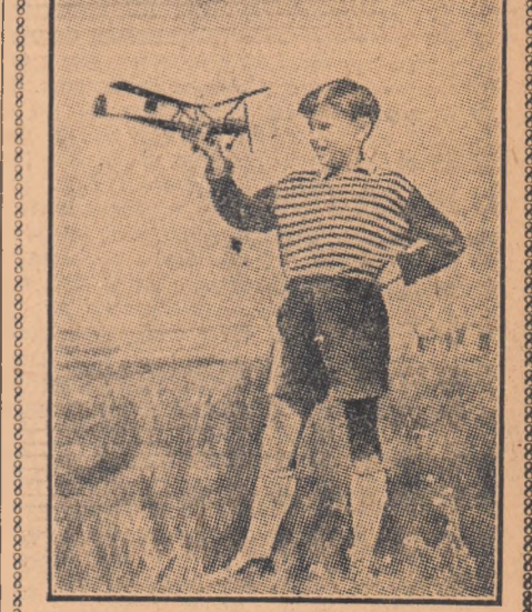
Aeromodellismul este unul din cele mai răspîndite sporturi în rîndurile tineretului cehoslovac. Iată, în fotografie, un tînăr aeromodellist, vîltor cuceritor al aerului, lansîndu-și modelul.