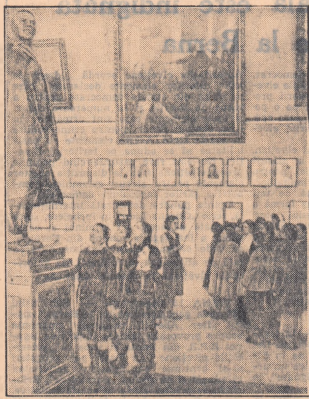
La Muzeul „V. I. Lenin — I. V. Stalin” de pe lângă C.C. al P.M.R., deschis de curînd — instituțiile care slujește operele de răspîndire a învățării marxist-leniniste — vin zilnic numeroși vizitatori. Este foarte largă categoria celor pe care muzeul îl ajută la studierea nescesatului tezaur al teoriei marxist-leniniste și a experienței istorice a Partidului Comunist al Uniunii Sovietice. Adevesea, în acest muzeu găsești alături de vîrstnici numeroși tineri și chiar pionieri.

În fotografia din stînga un grup de pionieri, iar în cea din dreapta un grup de elevi al Școlii medii tehnice de măsurători terestre — vizitînd muzeul.