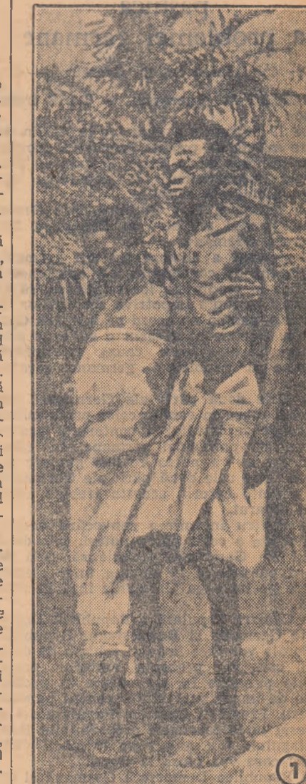
Prima fotografie reprezintă pe un tînr din Congo. El nu se poate mișca decât susținut de o altă persoană. Asta datorită vieții de mizerie la care sînt condamnați tinerii din colonii.

Tinerii din țările coloniale își string tot mai mult rîndurile în jurul F.M.T.D. — organizația iubită a tineretului democrat din întreaga lume — care exprimă năzuința lor spre independență națională și pace. În prezent, tineretul și popoarele din țările coloniale iau parte activă la mărirea campaniei pentru strîngerea de semnături împotriva unui război atomic. Crește lupta tineretului din colonii pentru pace, independență națională și libertate.