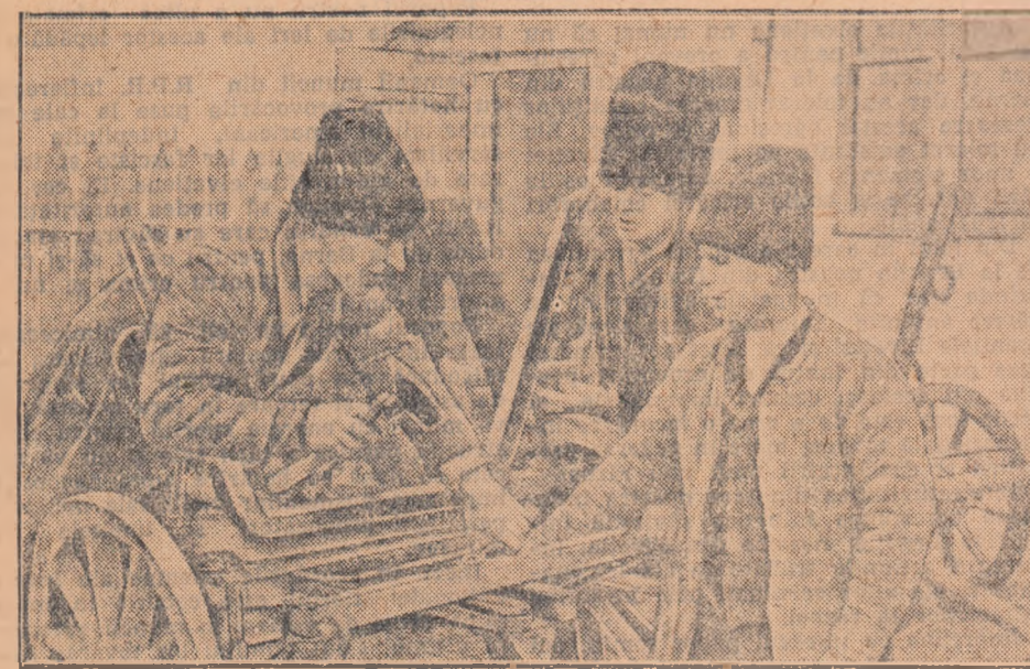
Țăranii muncitori din comuna Mărgineni, raionul Buzău, se pregătesc din vreme pentru aprofundează lucrări agricole. Ei își repară plugurile, grapele, căruțele, la centrele de reparat din comună. Numai la centrul de reparat nr. 1 au fost reparate 27 pluguri, 60 de căruțe și diferite unelte agricole.

La strîngerea recoltei tinerii colectivisti au cules de pe cele 3 porțiuni, recolte diferite.