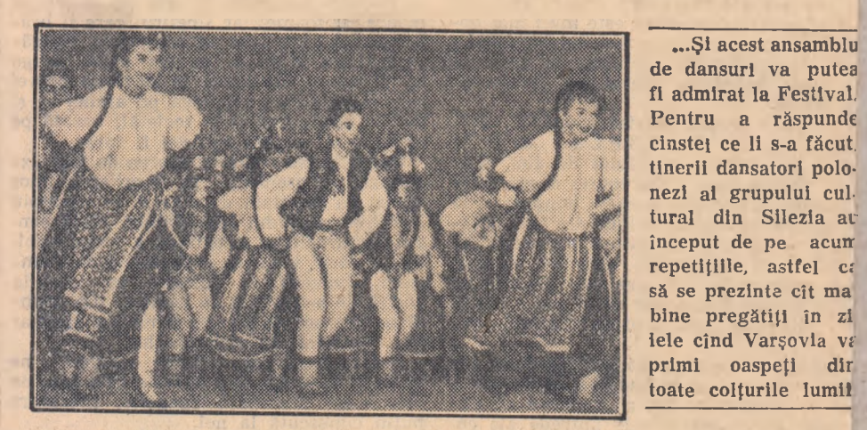
„Și acest ansamblu de dansuri va putea fi admirat la Festival. Pentru a răspunde cinstei ce li s-a făcut tinerii dansatori polonezi al grupului cultural din Silezia au început de pe acum repetițiile, astfel că să se prezinte cât mai bine pregătiți în zilele cînd Varșovia va primi oaspeți din toate colțurile lumii

JOSE CUESTO (Chile) deputat: „În prezent, cînd pacea este amenințată de aștiaștorii război, este necesar mai mult ca oricînd tinerii din lumea întreagă să-și strîngă legăturile de prietenie. Cînd tinerii din toate colțurile lumii își vor un cîntecele lor, sportul și manifestările culturale cînd ei vor discuta problemele lor în spirit frățesc, atunci tinerii vor trebui în mod inevitabil să tacă... Tinerii din țările Americii Latine, dintre care eu sunt unul, trăiesc oprimați; năzuiesc să poată face schimb de experiență cu tinerii din alte continente pentru a găsi calea spre prietel lor eliberări. Festivalul Mondial al Tineretului și Studenților va fi cea mai bună cale spre pace spre o mai mare înțelegere între popoare...”