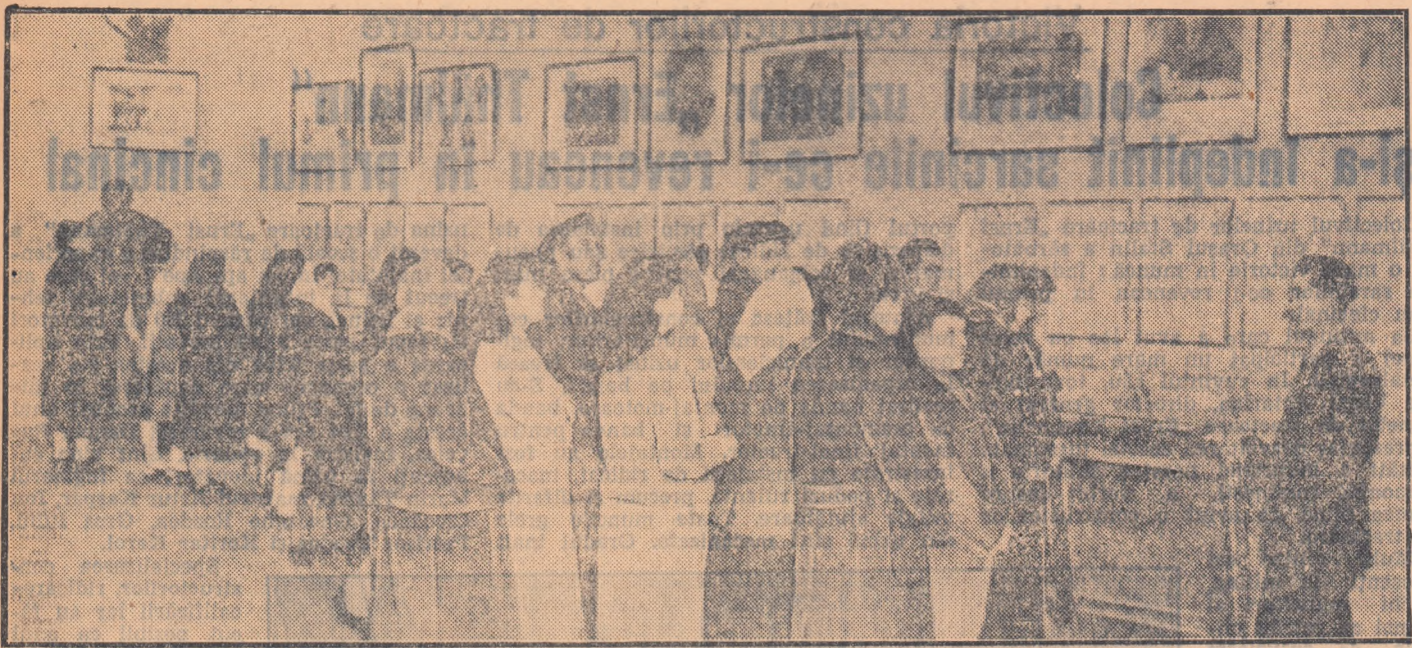
Numeroși oamenii ai muncii vizitează sălile Muzeului „V. I. Lenin” — I. V. Stalin” sorbind învățături de preț din glorioasa experiență de luptă a puterintelui Partidului Comunist al Uniunii Sovietice.