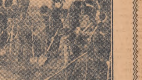
Institutul agronomic din București este cea mai bună din an.

din cartier care cultivă legume și zarzavaturi pe loturile din jurul ei. În luna din urmă sfatul popular rațional a pornit lucrări pentru secarea bălții, cerînd sprijinul în acest sens și comitetului raional U.T.M. Zilnic, zeci și sute de utemiști au venit să dea ajutor la săparea canalului de secare a bălții. Și iată că s-au făcut ultimele săpături — asta înseamnă sfîrșit.