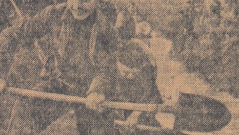
În Săptămîna Mondială a Tineretului, tinerii și tineretele din întreaga țară se pregătesc să participe la cel de al 5-lea Festival Mondial al Tineretului și Studenților.

La marginea cartierului Ducești-Cloplea, în raionul Tudor Vladimirescu din București se află o baltă care acoperă o suprafață de aproape 20 hectare. Baltă aceasta a adus întodeauna pe vremea ploilor, multe pagube cetățenilor