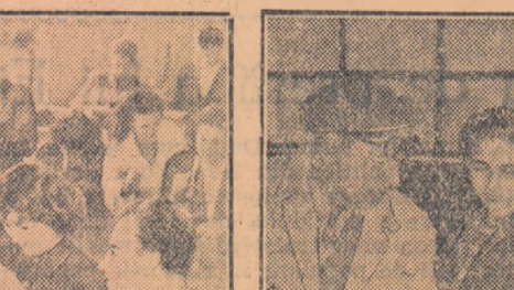
Grupă studențească 1509 din anul II al Facultății de agricultură de la

Elevii Școlii medii tehnice de mecanică nr. 2 din București au luat ho-