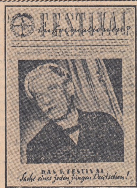
DAS V. FESTIVAL „Jede eines jeden jungen Deutschen!”

Pe stadioane tinerii trec normele G.M.A., participă la întrecerile crosu- lui în cinstea zilei de 1 Mai, contribuie la amenajarea bazelor sportive.