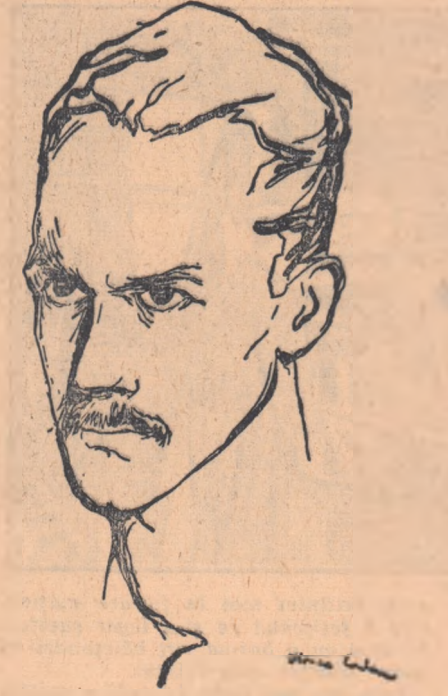
Desen de FLORICA CORDESCU

milă, ci te revoltă împotriva sistemului capitalist bazat pe exploatare. În poeziile sale cele mai minunate, poetul nu se mulțumește cu stărnirea indignării, ci scoate la iveală cu o precizie aproape științifică, cauze,