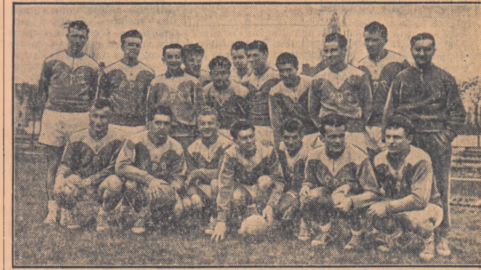
Lotul de fotbal — juniorii al Republicii Populare Romîne s-a clasat pe primul loc în serla întâia a „Turneului Internațional al juniorilor” ce s-a desfășurat în Italia.

Tinerii noștri fotbalști — printre cei mai buni din Europa