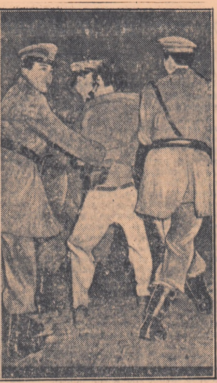
Articolul 17 din Constituția Italiană prevede: „Cetățenii au dreptul de a se intru în mod pașnic și fără arme...”. Acestea sînt vorbele guvernărilor! În fotografie: un aspect de la o manifestare care a avut loc la Roma împotriva reînmării Germaniei occidentale. Acestea sînt faptele guvernărilor!