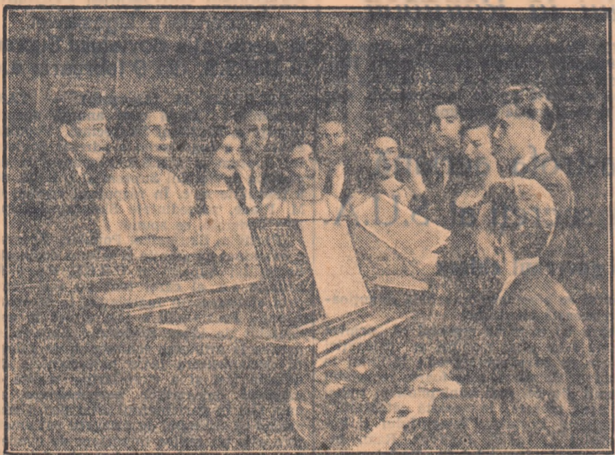
Ansamblul artistic al Uniunii Tineretului Muncitorilor din R.P.R., se pregătește intens pentru manifestările culturale ce vor avea loc cu ocazia celui de-al V-lea Festival Mondial al Tineretului și Studenților pentru pace și prietenie de la Varșovia.