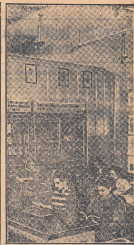
O carte bună este un minunat sfătuitor. La clubul-bibliotecă al Complexului Grivița Rosie din București, muncitorilor vine cu plăcere în orele libere să citească, să învețe.