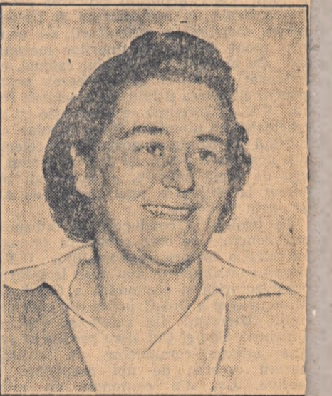
Angelica Rozeanu, Ella Zeller, Sari Szasz — care au făcut parte din reprezentativa de tenis de masă a R.P.R. — campioană mondială pe anul 1955.

Miercuri noaptea, în cadrul campionatelor mondiale care se desfășoară la Utrecht în Olanda, s-au desfășurat întilnirile finale pentru desemnarea campionilor mondiali la echipe pentru cupele „Corbillion” — femei și „Swaything” — bărbați.