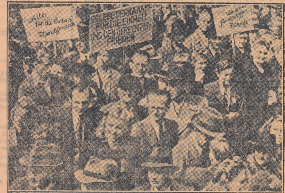
În întreaga lume capitalistă, ca un uriaș fluviu omenesc, se desfășoară coloanele manifestanților care cer pace și piine, asemenea acestor demonstrații germani.

Aceste aprecieri ale lui Lenin sînt pe deplin valabile și în zilele noastre. Căci guvernul american duc o politică „de pe poziții de forță” nu numai față de statele democratice, unde de altfel nu obțin nimic, ci și față de partenerii lor din țările capitaliste. E de ajuns să ne amintim amenințările repetate, oficiale sau mai puțin oficiale la adresa Franței pentru a o determina să ratifice nefastele acorduri de la Paris, presuniile asupra Indiei, recentele amenințări deschise la adresa Siriei, oprirea unui vas petrolifer finlandez care se îndrepta spre R. P. Chineză, presiunile asupra Japoniei cu scopul de a sili să încheze tratativele pentru reluarea relațiilor cu Uniunea Sovietică etc. Această politică contrastează profund cu acțiunile guvernului sovietic care urmărește relații amicale pe bază de egalitate cu toate statele.