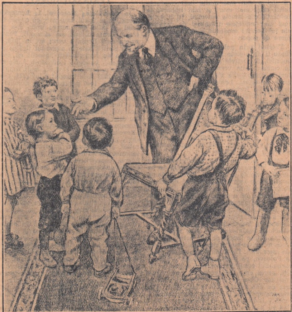
V. I. Lenin în mijlocul copiilor

Alături de toți oamenii muncii, tineretul muncitor sărbătorește cea de-a 85-a aniversare a nașterii lui V. I. Lenin, încheindu-și forțele și muncind neîncetat pentru triumful învățării leniniste, pentru construirea socialismului în patria noastră.