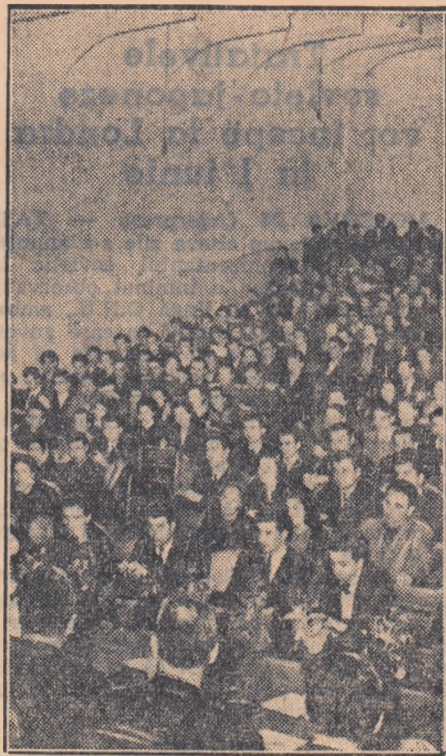
Zilele trecute a avut loc sesiunea științifică a studenților de la I.S.E.P. În fotografie: un aspect din sala în timpul expunerii unui referat.

Tineri și tinere, care muncii pe ogoare! Folosiți din plin fiecare oră, fiecare zi bună de lucru pentru grăbirea lucrărilor de primăvară. Participați la acțiunile de scurgere și apelor de pe semănături, cereți să lucrați în schimb al doilea pe tractoare, folosiți întreaga capacitate de lucru a tractoarelor și atelelor! Lucrările făcute de voi să fie de cea mai bună calitate. Nu uitați că munca voastră contribuie la obținerea unor recolte bogate, pentru creșterea bunel stări a poporului. „Nici un petec de pământ să nu rămînă neînsămînțat“.