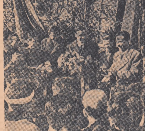
Intocmai ca și mulți alții, noi am sosit în Japonia șiînd prea puține lucruri despre adevărata situație existentă în această țară.

Acum, după ce am vizitat Japonia, trebuie să recunoașc că muncitorii japonezi și în special tinerii muncitori sînt deosebit de activi în lupta pentru apărarea intereselor lor. Am putut să-i vedem în întreaga Japonie pe acești tineri muncitori în diferite acțiuni în greve, la demonstrații și la intruriri la manifestații în cursul cărora au arătat atît de multă forță, perseverență și curaj încît ne-au entuziasmat, făcîndu-ne să fim mindri și fericiți că mergem în coloana elături de ei.