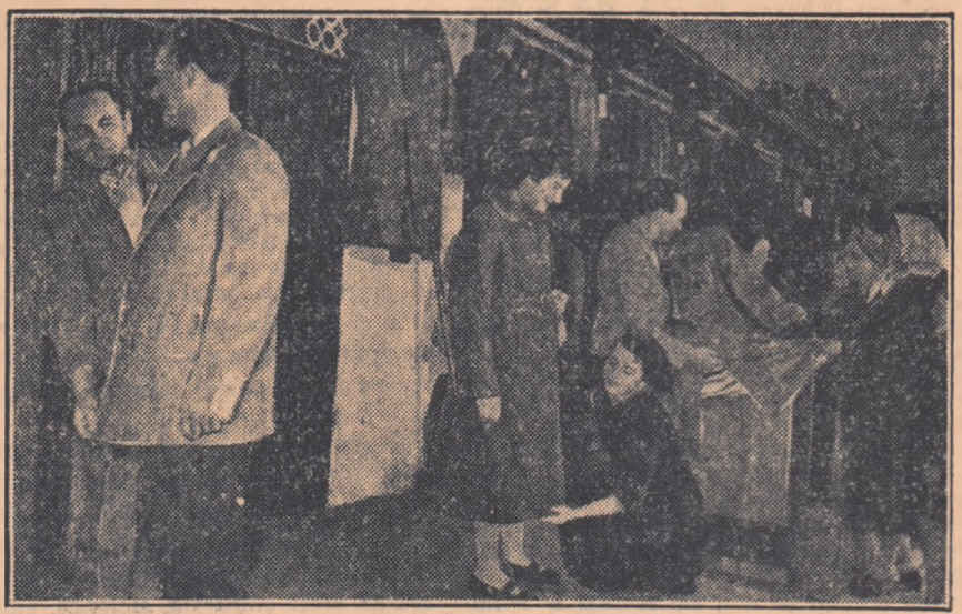
În urma reducerii de prețuri, tot mai mulți cumpărători se îndreaptă către magazine. Un costum de haine, care înainte costa 563 lei, acum costă 394 lei. În fotografia un aspect de la magazinul „Confecția” unitatea 102 din B-dul 1 Mai din Capitală.