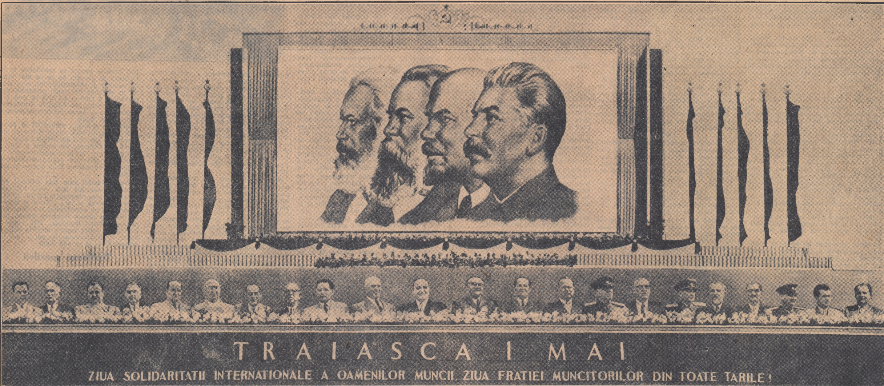
TRAIASCA I MAI ZIUA SOLIDARITĂȚII INTERNAȚIONALE A OAMENILOR MUNCII, ZIUA FRĂȚIEI MUNCITORILOR DIN TOATE TARILE!

pante la consfăturile și în al doilea rînd, la problema organizării comandamentului unificat al statelor participante la Tratat. In prezent, avînd în vedere ratificarea acordurilor de la Paris, statele amintite mai sus au convenit să convoace la Varșovia, la 11 mai, cea de a doua consfătură pentru discutarea problemelor ce decurg din hotărârile consfătuirii de la Moscova. La consfătură de la Varșovia va lua de asemenea parte guvernul Republicii Populare Chineze, care va trimite la această consfătură observatorul său.