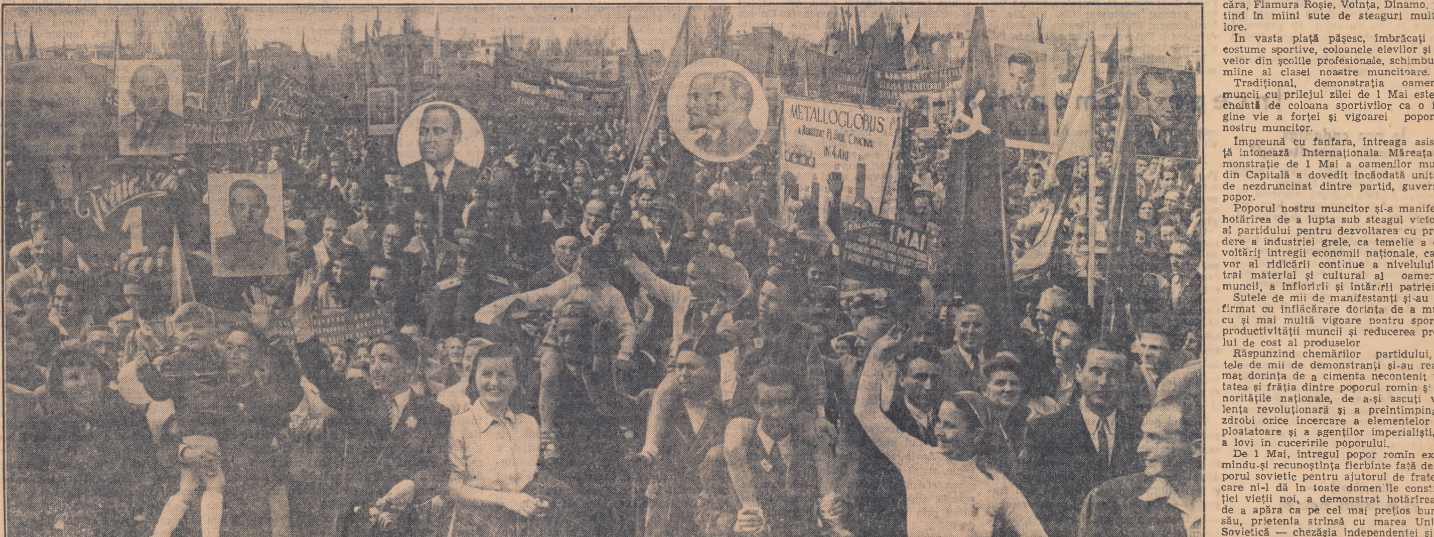
Un aspect al demonstrației de 1 Mai din Piața „I. V. Stalin” din Capitală.

De 1 Mai, întregul popor român expmîndu-și recunoștința fierbinte față de poporul sovietic pentru ajutorul de frate care ni-l dă în toate domeniile construcției vieții noi, a demonstrat hotărîrea de a apăra ca pe cel mai prețios bun său, prietenia strînsă cu marea Uniune Sovietică — chezișia independenței și securității patriei noastre, a viitorului ei însoțit.