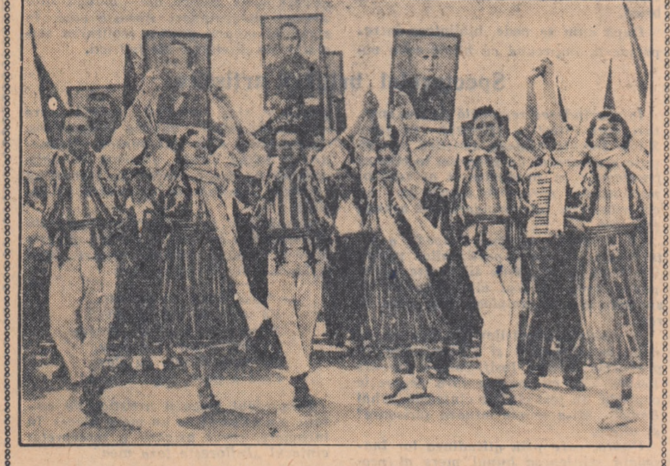
În cîntec și joc, plini de voioșia vîllelor noastre libere, trec prin fața tribunei membrii unei echipe artistice de amatori.

alții din comuna Armăești sînt fruntași la însămînțatul porumbului. Datorită muncii politice susținute ce se duce în rîndul țăranelor muncitori din comuna Giurgi, Ion Roată, Balaciu, Armăești și altele, s-a reușit să se obțină succese frumoase în această direcție. Astfel, pînă în seara zilei de 29 aprilie, în întreg raionul Urziceni s-a însămînțat cu porumb o suprafață de aproximativ 2.500 hectare. Colectivștii din comunele Broșteni, Malu, Giurgi, Cocora, avînd în față experiența pozitivă a anului trecut, însămînțează și anul acesta întreaga suprafață destinată culturii porumbului în cuiburi așezate în pătrat.