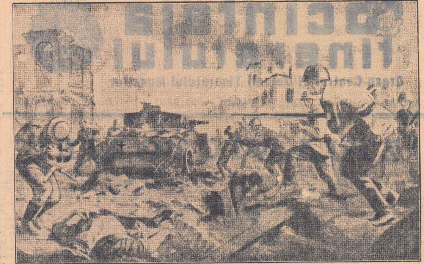
ATANASIU PAUL — Luptele de la Debreșin ale Diviziei Tudor Vladimirescu

Sărbătorind Ziua Marelui Victoriei, po- porul nostru muncitor se avîntă și mai mult spre cîmliile însoțite ale vitejii noi, în lupta pentru îndeplinirea planului cin- cinal, în lupta pentru ridicarea nivelului de trai, material și cultural al poporului nostru, în lupta pentru întărirea capaci- tății de apărare a patriei noastre.