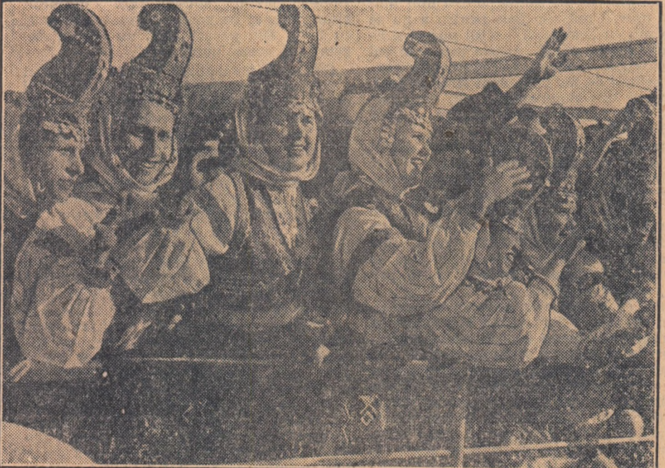
Duminică, pe Dunăre a avut loc o intilnire prietenească între tinerii romîni și bulgari. Din Giurgiu și din Ruse, tineri din cele două țări prietene s-au imbarcat pe vase și împreună au petrecut cîteva ore într-o plimbare fluvială. Intilnirea a demonstrat frăția care unește pe tinerii ce trăiesc pe ambele maluri ale Dunării. Cuvintele prietenești schimbate, atmosfera de entuziasm, bucuria cu care tinerii au legat prietenii trainice — arată că năzuințele tineretului romîn și ale celui bulgar sînt comune, că aceeași hotărîre de luptă pentru apărarea păcii și pentru cînsurirea socialismului însuflețește pe tinerii din ambele țări.