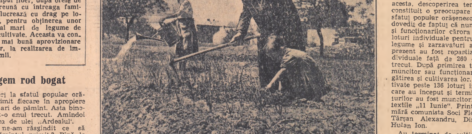
ANUL acesta tot mai mulți muncitori din fabrici, uzine și instituții au cerut sfaturilor populare să li se repartizeze loturi individuale pentru cultivarea legumelor. În timpul liber după orele de producție împreună cu întreaga familie muncitorii lucrează cu drag pe loturile căpătate, pentru obținerea unor cantități cât mai mari de legume de pe suprafețele cultivate. Aceasta va contribui la o tot mai bună aprovizionare a familiilor lor, la realizarea de importante economii.