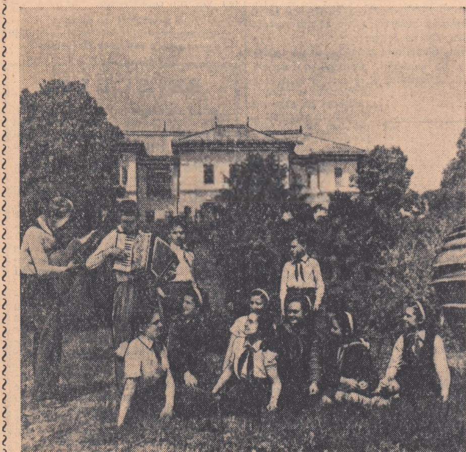
Se împlinesc în curînd 5 ani de la inaugurarea Palatului Pionierilor din Capitală, 5 ani de cînd copiii își petrec aici timpul lor liber cu folos, plăcut, interesant. Activitatea multilaterală desfășurată în cercuri i-a făcut pe sute și mii de pionieri să îndrăgească mai mult materiile predate în școală, a descoperit printre ei talente deosebite, le-a trezit dragostea de muncă, i-a întărit fizic.

Tineretul patriei noastre trimite Adunării reprezentanților mișcării pentru apărarea păcii din R.P.R. un călduros salut, asigurînd-o că va lupta neobșit pentru întărirea și înflorirea patriei, pentru întărirea capacității ei de apărare, pentru triumful păcii și al colaborării între popoare.