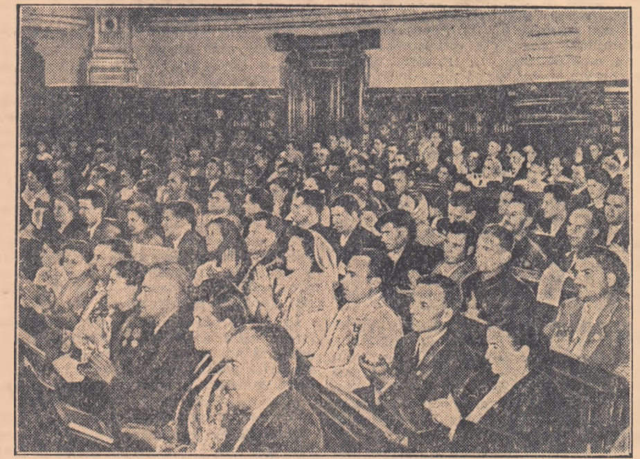
Un aspect din sala Adunării

Sutele de delegații au venit la Adunare pentru a exprima opinia tuturor păturilor populare române față de problemele actuale ale situației internaționale și voința sa de a-și uni eforturile cu cele ale tuturor popoarelor iubitoare de pace în lupta pentru preîntâmpinarea unui nou război și pentru instaurarea unei păci trainice în întreaga lume.