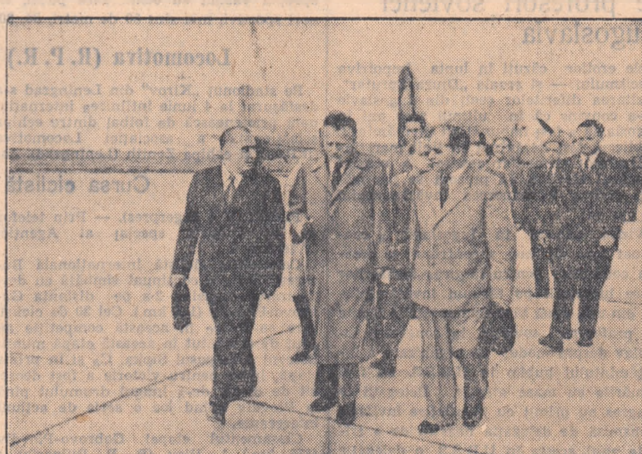
Sosirea tovarășilor Antonin Novotny și Jiri Hendrich pe aeroportul Băneasa