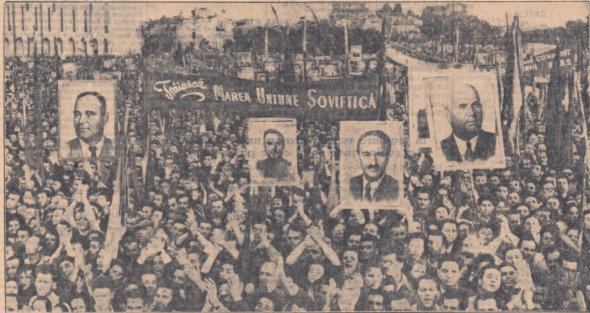
Aspect de la marea mîting din Piața Victoriei

Recepția s-a desfășurat într-o atmosferă cordială. (Agerpres)