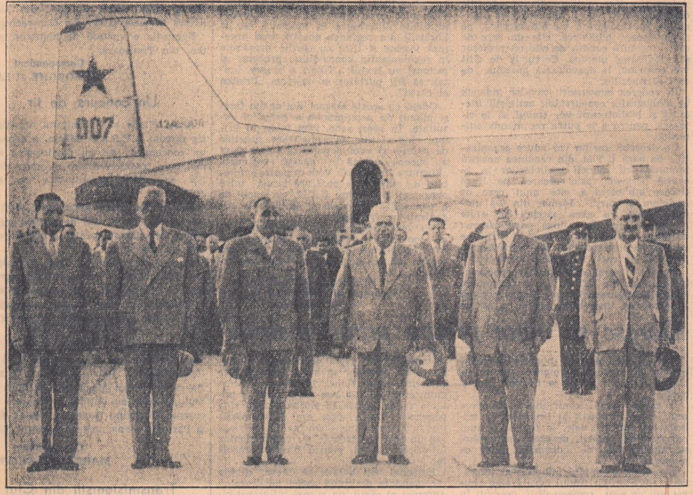
Pe aeroport, de la stînga la dreapta: tovarășii Gh. Apostol, Petru Groza, Gh. Gheorghiu-Dej, N. S. Hrușciov, N. A. Bulganin, A. I. Mikolan.