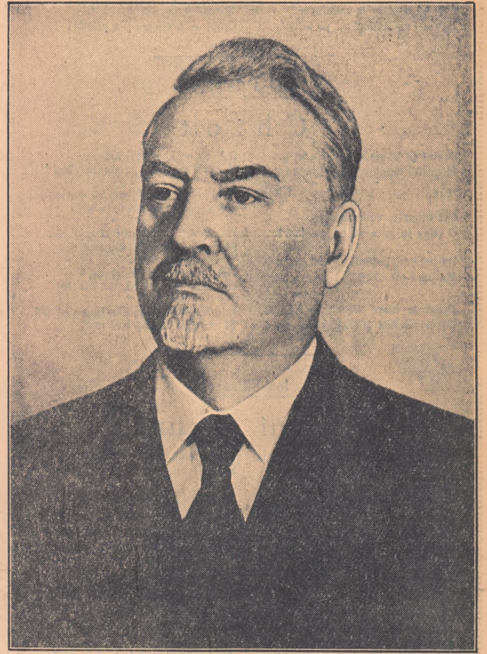
Tovarășului NIKOLAI ALEKSANDROVICI BULGANIN Președintele Consiliului de Miniștri al U.R.S.S.