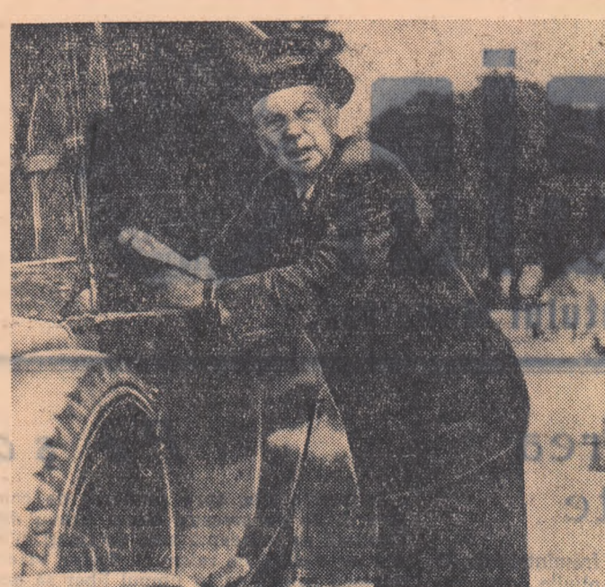
O scenă din film