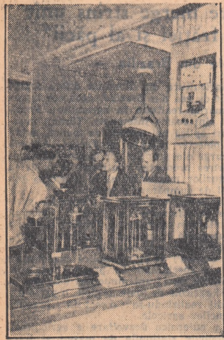
În sala Magheru din Capitală s-a deschis de curând expoziția „Instrumente tehnice în R. P. Ungară”. Zilnic vin aici numeroși vizitatori. Fotografia redă un aspect al expoziției.