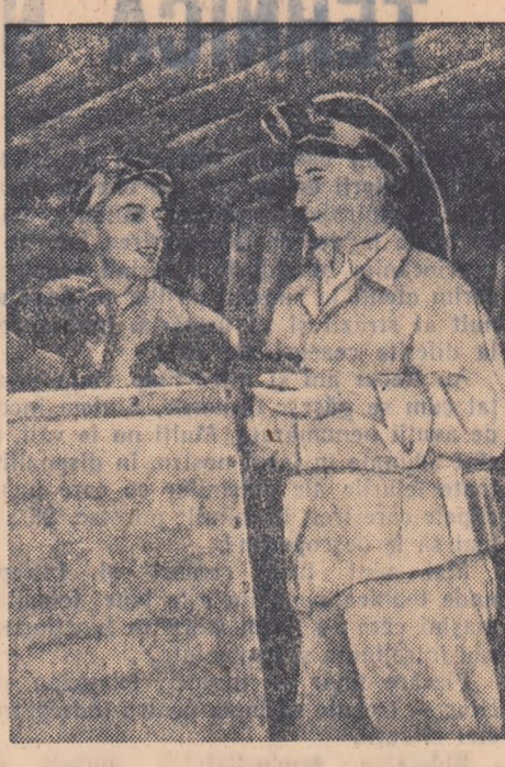
Imbunătățirea permanentă a calității cărbunelui extras din adîncimile pămîntului, este una din sarcinile pe care partidul și guvernul le-au pus în fața minerilor noștri. În bazinul carbonifer Filippești de pădure, îndeplinirea acestei sarcini cunoaște o atenție sporită.

Acum cîteva zile a avut loc constituirea comisiei raionale Snagov a concursului „Iubiți Cartea”. Din comisia raională fac parte activiști ai comitetului raional U.T.M., tineri deputați, tineri directori de cîmine culturale etc. Comisia și-a întocmit un plan de muncă bogat pe baza căruia își propune să mobilizeze întreg tineretul din cuprinsul raionului pentru a participa la acest concurs. Primele măsuri pe care și le-a propus comisia raională sînt cele care privesc aprovizionarea bibliotecilor sătești cu toate cărțile prevăzute pentru concurs, organizarea unor noi cercuri de citit precum și a cercurilor de prietenii ai cărții.