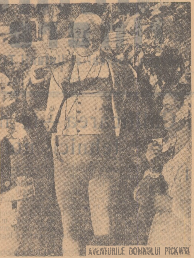
AVENTURILE DOMNULUI PICKWICK

Priviți prima fotografie: Nu-i așa că recunoașteți? Este domnul Pickwick, pe care l-ați cunoscut în paginile romanului lui Charles Dickens și pe care a-veți prilejul să-l vedeți în film.