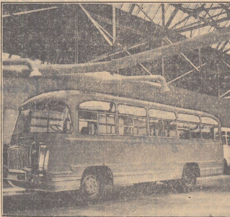
De curînd, colectivele uzinelor „Mao Tze-dun” și „Tudor Vladimirescu” din Capitală, au obținut strălucite succese. Muncitorii, inginerii și tehnicienii de la „Mao Tze-dun” au construit autobusul romînesc tip M.T.D. 55. Primul autobu-