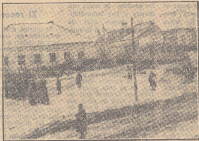
Solemnitatea depunerii jurămîntului la Batovje în Cehoslovacia

„Jur să lupt pînă la ultima picătură de sînge contra fasciștilor care mi-au tîrîț țara în războiul lor nelegiuit...”