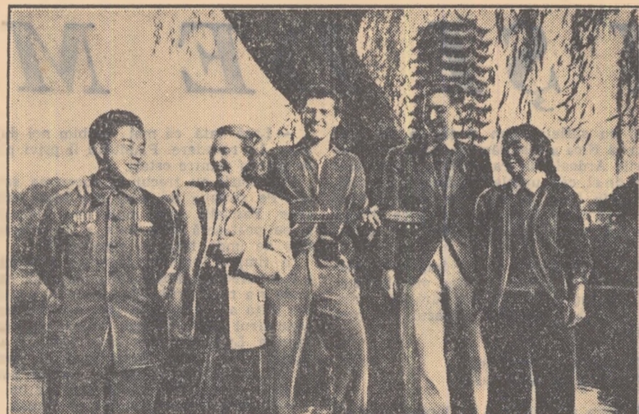
În zilele vacanței, studenții din țările de democrație populară, care învață în R. P. Chineză, se distrează, plimbîndu-se în parcul universității din Pekin.

● Cu prilejul meciului de fotbal dintre selecționata U.R.S.S. și Republicii Federale Germane, la 17 august a sosit la Moscova, cu un tren special, primul grup de turiști germani compus din 347 de persoane.