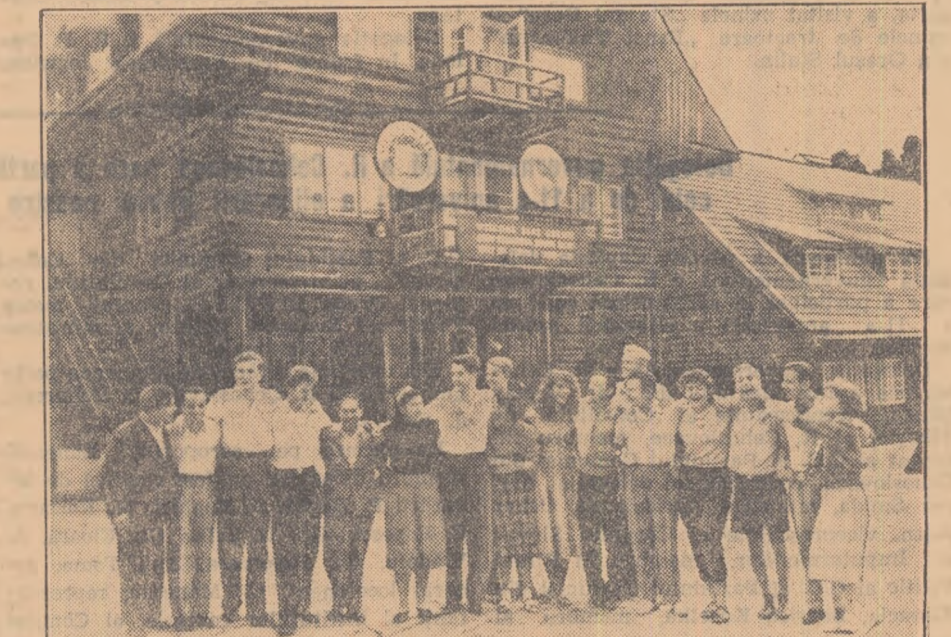
Deschiderea taberei internaționale studențești de la Timișul de Sus

Algeria are o populație de 10.500.000 locuitori din care 5.500.000 musulmani, adică algerieni, poartă numele Brahimi Lakdar. Restul de un milion sînt europeni — francezi, spanioli etc. La această populație sînt 5.000 de studenți dintre care 4.500 europeni și numai 500 musulmani. În facultăți, în școlile medii și elementare limba de predare este cea franceză. Limba ma-