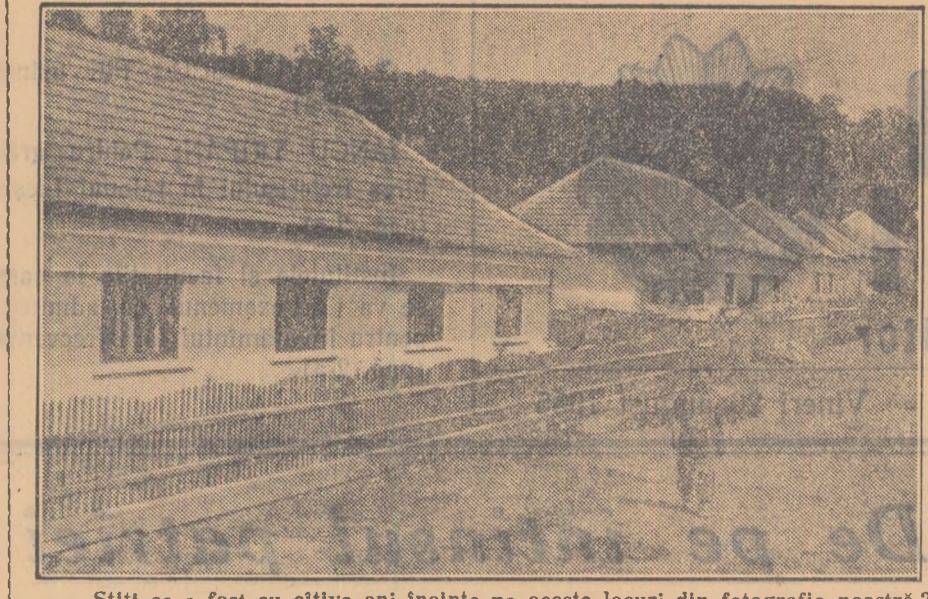
Știi ce a fost cu cițva ani înalțate pe aceste locuri din fotografia noastră? Cimp liber și burulen.

Acum, o nouă stradă a apărut pe harta comunei Derna. Prin ajutorul acordat de stat, 35 familii de mîneri din comuna Derna, regiunea Oradea și-au construit în anii 1954-1955 locuințe individuale moderne. Alte 55 de locuințe individuale vor fi terminate pînă la sfîrșitul anului acesta.