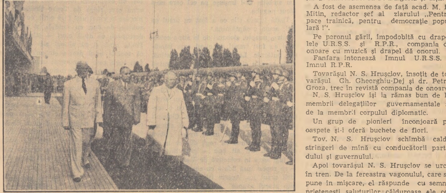
Tovarășul N. S. Hrușciov, însoțit de tovarășii Gh. Gheorghiu-Dej și dr. Petru Groza, trec în revistă compania de onoare.