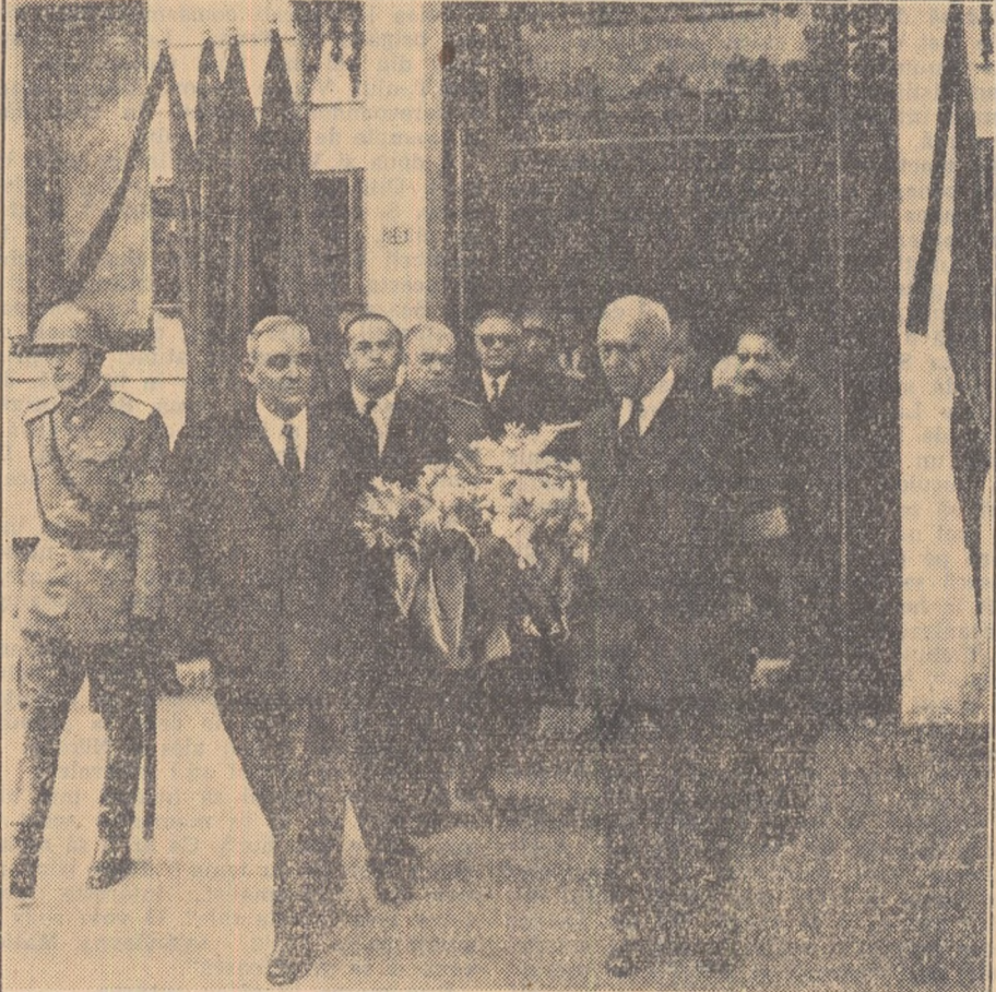
Conducătorii partidului și guvernului purtînd sticla cu corpul neînsușit al tovarășului Lotar Rădăceanu

În toate sectoarele în care a muncit, ca ministru al Muncii și apoi al Prevederilor