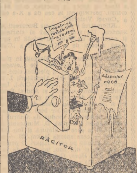
Să se răcoarească înfierbântarea adepților „războiului rece”! (După „Literaturna Gazeta”)

În lumea occidentală unii politicieni reacționari nu renunță la falmăntura politică a „războiului rece” (zările).