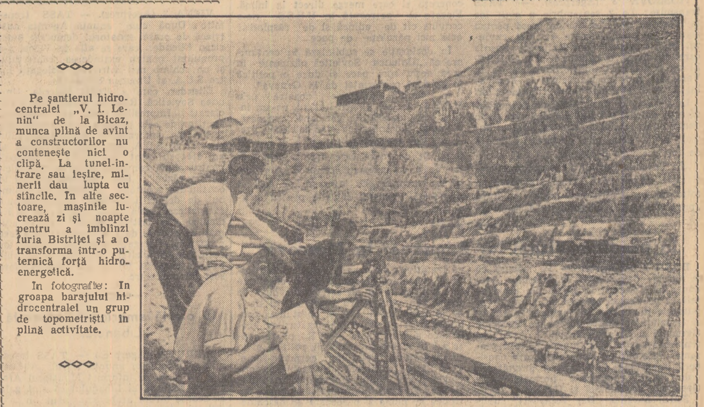
Pe șantierul hidrocentralei „V. I. Lenin” de la Bicaz. Munca plină de avînt a constructorilor nu conțenește nici o clipă. La tunel-intrare sau leșire, mizerii sau lupta cu stîncile. În alte secțiuni, mașinile lucrează zi și noapte pentru a imblîzi furia Bistriței și a transforma într-o puternică forță hidroenergetică.

În fotografie: În grupa barajului hidrocentralei un grup de topometristi în plină activitate.