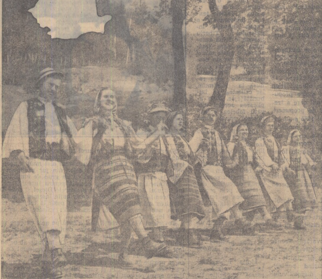
Familia minerului Jarinca

Deasupra văii funicularelor cu mine-reu străbat distanțe și înălțimi, stră-nind un zgomot asemănător tropotului unor cai.