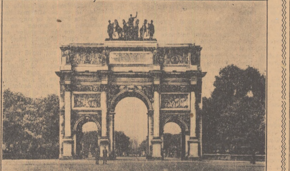
Arcul de Triumf al Carroussel-ului.

mică și scenele interpretate în genul comediei de l'Art, o minunată imagine multă a exprimat disprețul și ura adevăraților apărători ai culturii progresiste franceze împotriva jughului grasent, dizolvant al culturii pure. Era finalul spectacolului; multă liniște ca întotdeauna cînd intră artist și spectator s-au întins cordele nevăzute ale înțelegerii și emoției comune. O umbră — atît de cunoscută și dragă — se profilază: o gambeta, haine demodate, atîrnînd pe un corp mic, niște galoși și un mers cu totul deosebit. Da, este profiul lui Charlie Chaplin, marele artist progresist. Umbra face cîștia pași, se apropie pînă parcă să îmbrățișeze publicul, oamenii. Din spate apare însă o altă umbră: o castă, epoleți, cizme — înalțează și com-