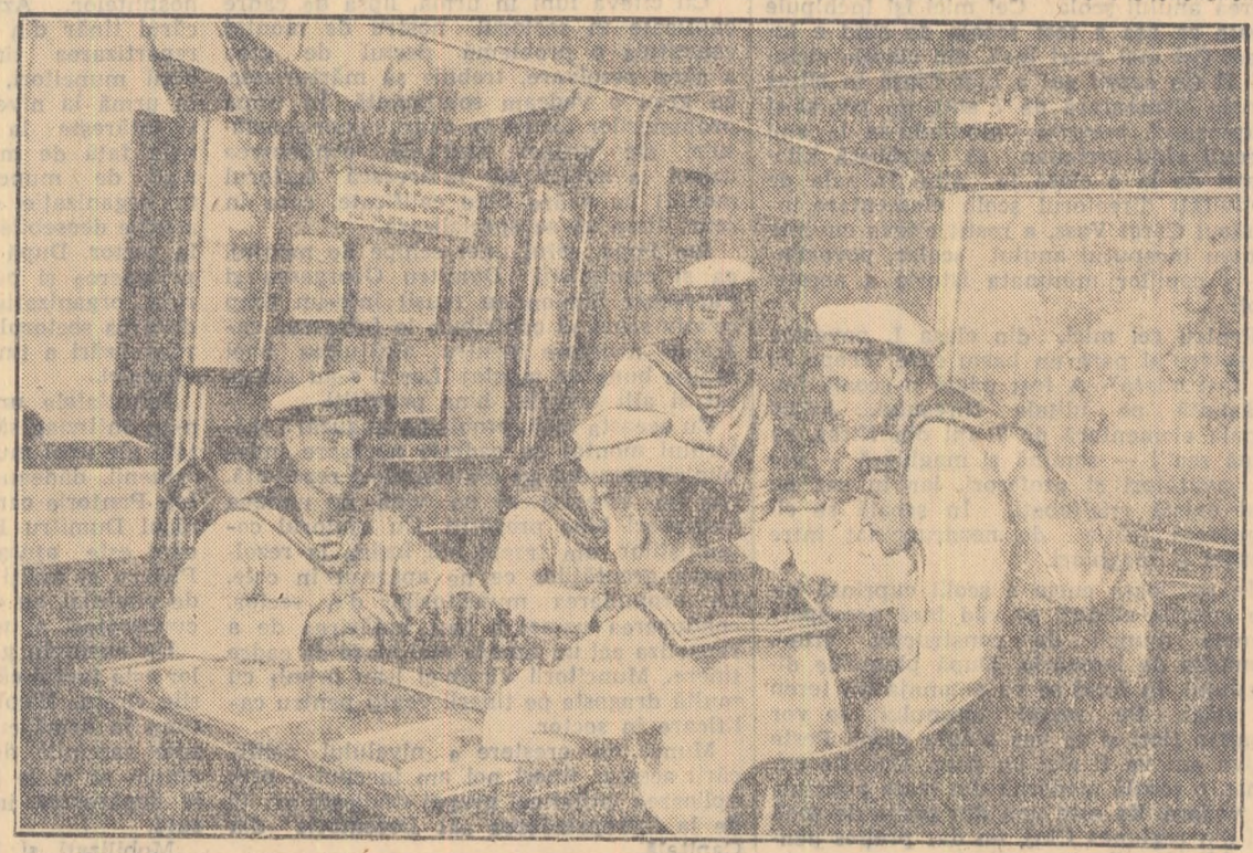
Deosebit de plăcut, își petrec timpul liber marinarii din flota noastră maritimă la tîmna. Fotografia noastră redă doar un singur aspect: sașiștii își dispută dirzi tîntiletea.