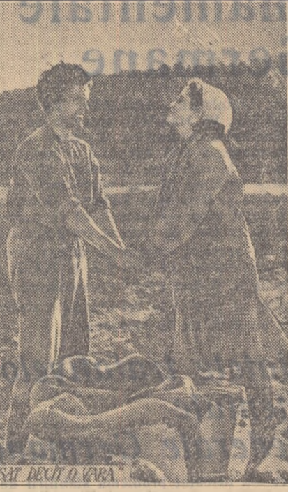
„N-A DANSAT DECÎT O VARĂ”

Mulț mai bine s-ar fi transmis însă conținutul de idel al filmului dacă sfîrșitul ar fi dat o perspectivă mai clară asupra rezolvării conflictului nelămurit nîl o porții pentru concluzii confuze, pesimiste, precum și dacă s-ar fi dezvoltat mai profund caracterul forțelor sociale a căror înfruntare își găsește ilustrarea în această povestire simplă. Se poate spune totuși că realizatorul filmului (scenarist: W. Semittov, regizor: Anne Mattson) au merite deosebite în realizarea marii simplități a filmului, în găsirea acelor mijloace de expresie care corespund perfect acțiunii, caracterului celor două personaje centrale. Este demnă de remarcă și grija pentru desăvîrșirea frumuseții și poeziei a scenelor de dragoste îndesate, în care nu există nici un fel de accentuare vizuale ce ar fi putut periclită calitatea paleului. Sînt de neuitat episoade ca acela al dansului pe estrada de la marginea lacului — cînd apropierea tot mai strînsă a celor doi tineri valșind, sugerează ideea deplină comunității sufletesti dintre ei — ca și scena cînd Göran și Kerstin mîridesc să se îmbrățișeze în văzduh