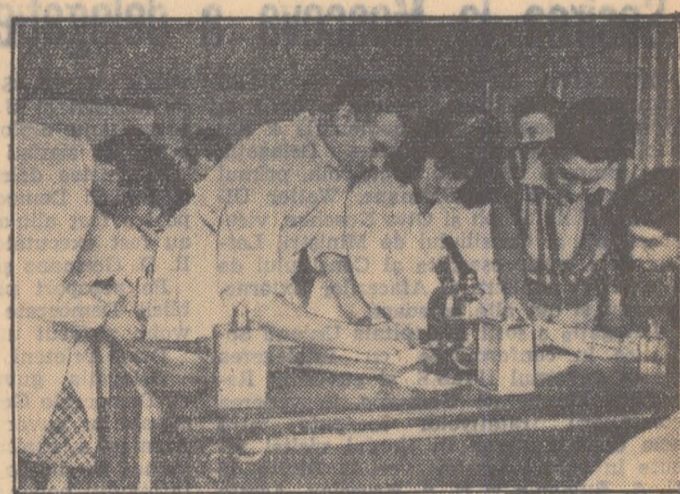
Studenți din anul I al Institutului de medicină la lucrări practice

correspondentul „Scintei tineretului” pentru regiunea Iași