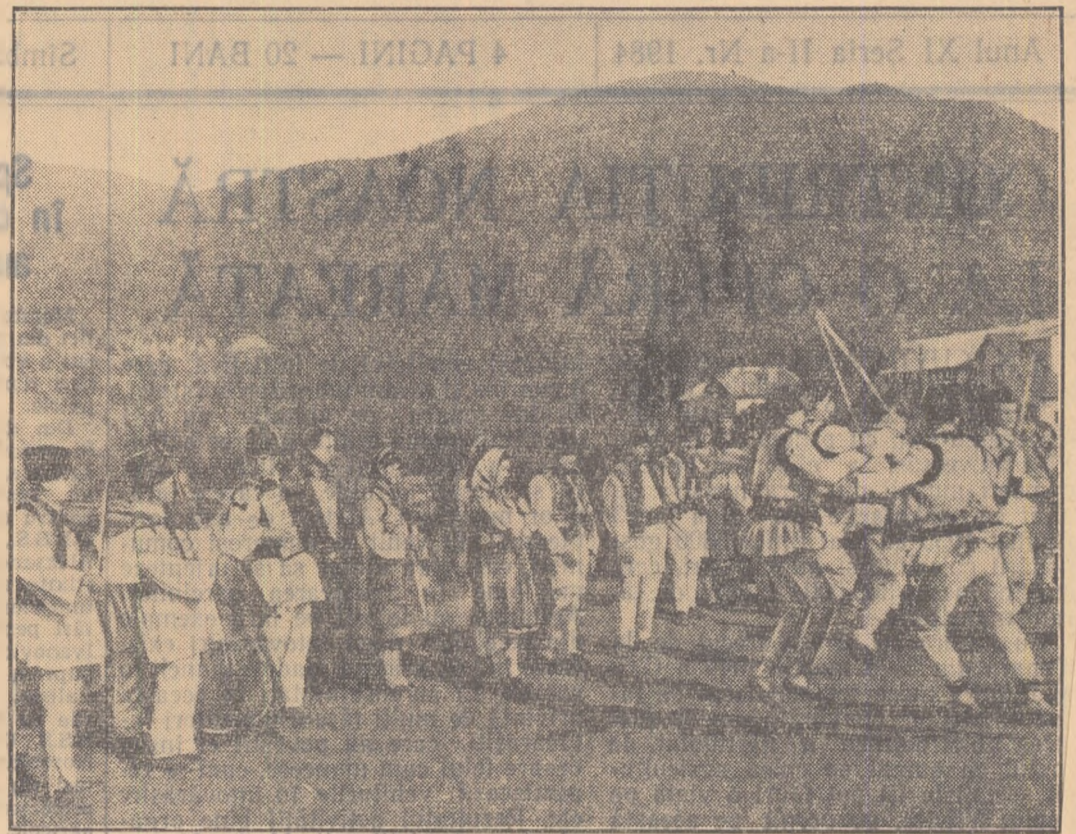
De-a lungul lui, filmul surprinde nenumărate formații de artiști amatori care prin talentul cu care interpretează cîntecul și dansurile populare îl fermecă pe spectator. Scenariul și regia care aparțin lui Ion Bostan, Laureat al Premiului de Stat, au folosit din plin frumusețea folclorului nostru, precum și izvorul inspirației altor barzi anonimi-patria cu oamenii, bogățiile și minunatele ei priveliști. (In fotografie: o scenă din film).

Pe ecran se perindă apoi nenumărate formații de artiști amatori care dau viață frumuseții și bogăției dansurilor noastre populare moștenite din bătrîni. Fetele din Oltenia — pe care filmul le prezintă în toată grația și gingășia lor — interpretează și astăzi vechiul dans „Hora crățelor”. Te cuceresc gesturile pline de grație, mîdierea cu care tineretea interpretează redau gingășia crățelor.