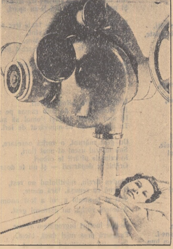
Instalație terapeutică cu raze gama cu o încălzire de cobalt radioactiv de 400 curie. Cu acest aparat pot fi iradiate tumori care se află la orice adîncime.

Cumpărătorul care intră pentru prima oară în acest magazin neobișnuit din Leningrad rămîne uimit. Aici nu există teighele și vînzători. De-a lungul peretilor, pe rafturi, stau orînduite diferite articole de menaj. Fiecare cumpărător își alege singur obiectul necesar și-l duce la casieria-ambalaj. Întregul magazin este deservit de trei oameni. Experiența acestui magazin, primul de acest fel din Uniunea Sovietică, este studiată și de lucrătorii din comerț din Moscova, Erevan, Murnansk și din alte orașe. În prezent, la Leningrad, în afară de acest magazin de mărfuri industriale mai există două magazine de desfacere a pîinii și douăsprezece magazine de desfacere a produselor alimentare fără vînzători.