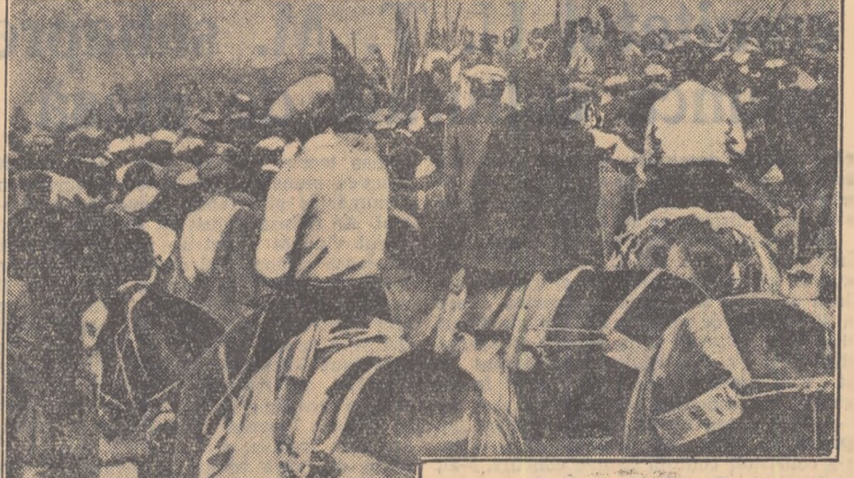
Un mînting organizat la Partella della Ginestra, cu prilejul comemorării unor muncitori agricoli omorîți în timpul luptei pentru pămînt.

problemelor de fond ale structurii sociale și economice ale agriculturii italiene. Intervenția capșenilor bisericilor catolice spre a înălțura pe conducătorii tineretului catolic și ai secției de tineret a partidului democrat-creștin, vinovați de a fi arătat un interes prea mare pentru soarta tineretului de la sate, nu a reușit să înlăture această mișcare.