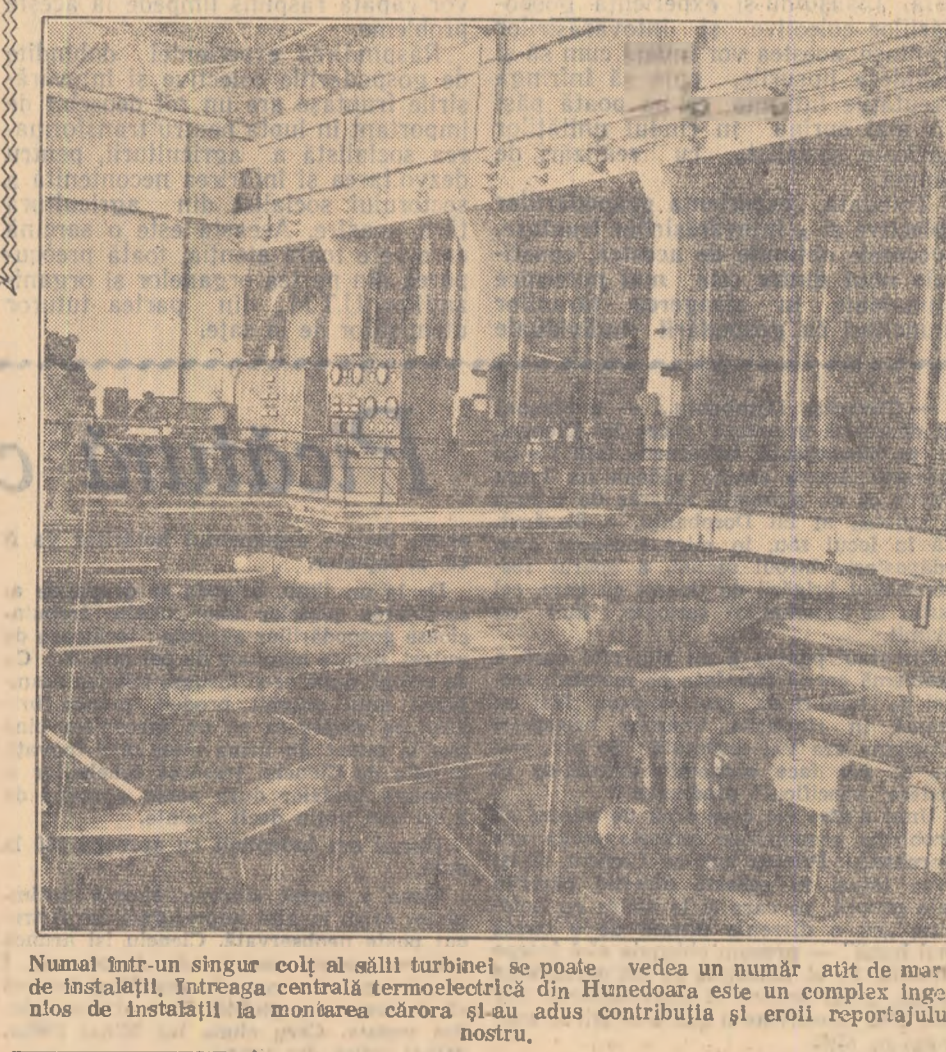
Numai într-un singur colț al sălii turbinei se poate vedea un număr atît de mare de instalații. Întreaga centrală termoelectrică din Hunedoara este un complex ingenios de instalații la montarea cărora și-au adus contribuția și eroii reportajului nostru.

s-au întors în centrală și au lucrat pînă dimineața. Acum debitul conductei satisface necesitățile.