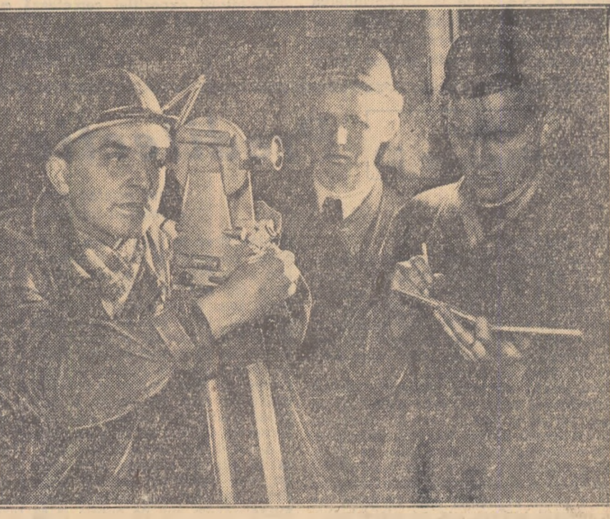
În minele din R. P. Polonă au fost create condițiuni cît mai bune de muncă prin folosirea tehnicii celei mai înaintate. Iată în clișeu trei tineri de la minele de fier „Dzbow” folosind un aparat special de măsurare.