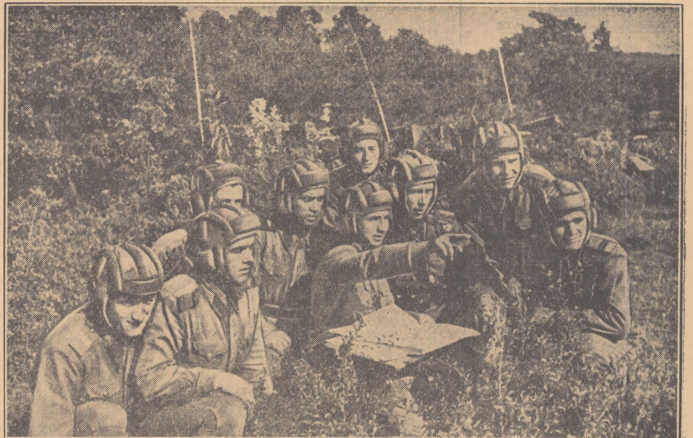
Înaintea începerii exercițiului, comandanții subunității explică tanchiștilor misiunea ce o au de îndeplinit.