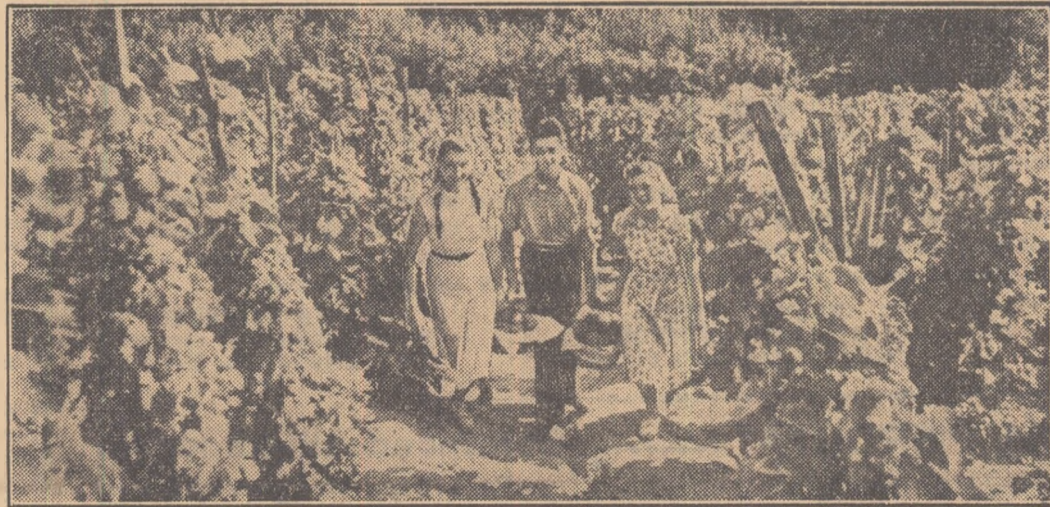
Culesul strugurilor... Prilej de mări bucurii, de cîntec și vole bună! Au pornit culegătorii să strîngă ciorchînii mari și grel și să-l ducă spre ciorăh. Și prutîndeni în vii, în aceste zile, domnește veselia.