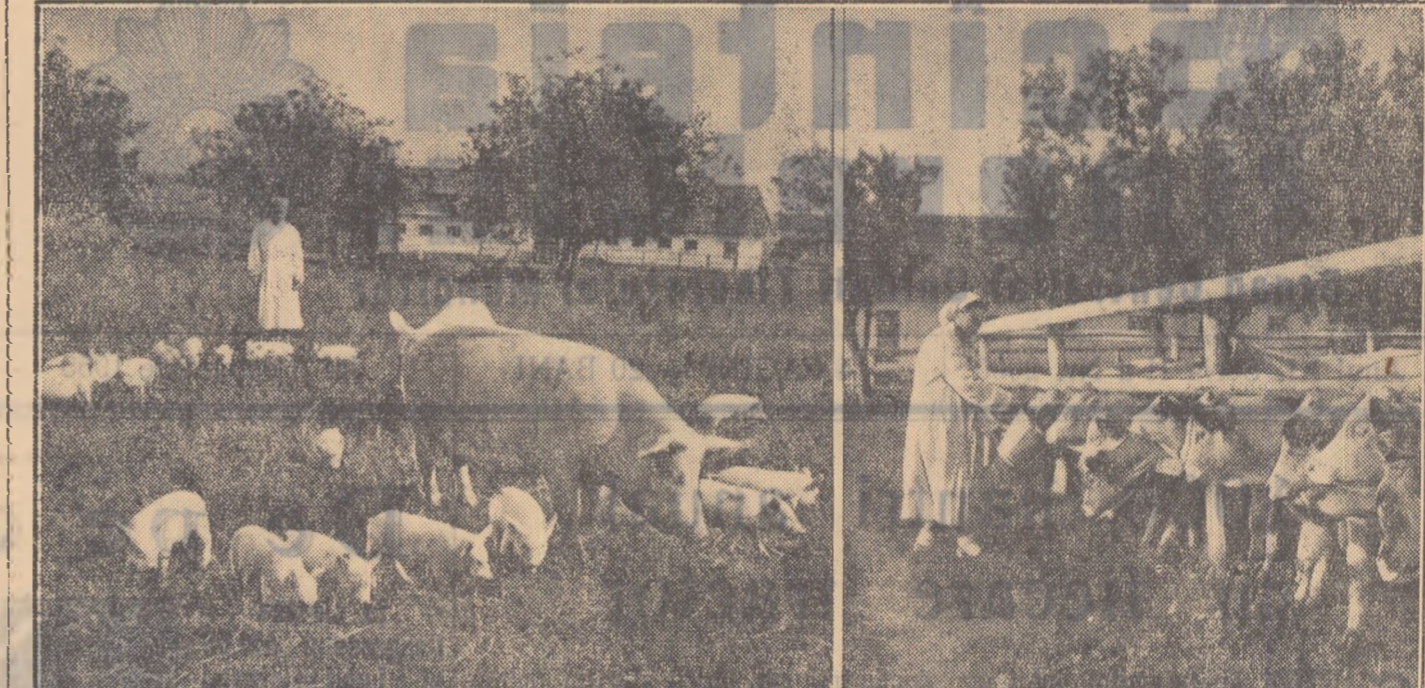
La Stațiunea experimentală din Popăuți...

La Stațiunea experimentală a Institutului de Cercetări Zootehnice din Popăuți, raionul Botoșani, oamenii de știință, ingineri, zootehniști, medici veterinari, studiază și experimentează cele mai bune procedee de ameliorare a diferitelor rase locale de animale și crearea de rase noi mai productive, mai rezistente. Pentru ca rezultatele cercetărilor să fie urmărite cu ușurință, mai rezistente. Pentru ca rezultatele cercetărilor să fie urmărite cu ușurință, mai rezistente. Pentru ca rezultatele cercetărilor să fie urmărite cu ușurință, mai rezistente.