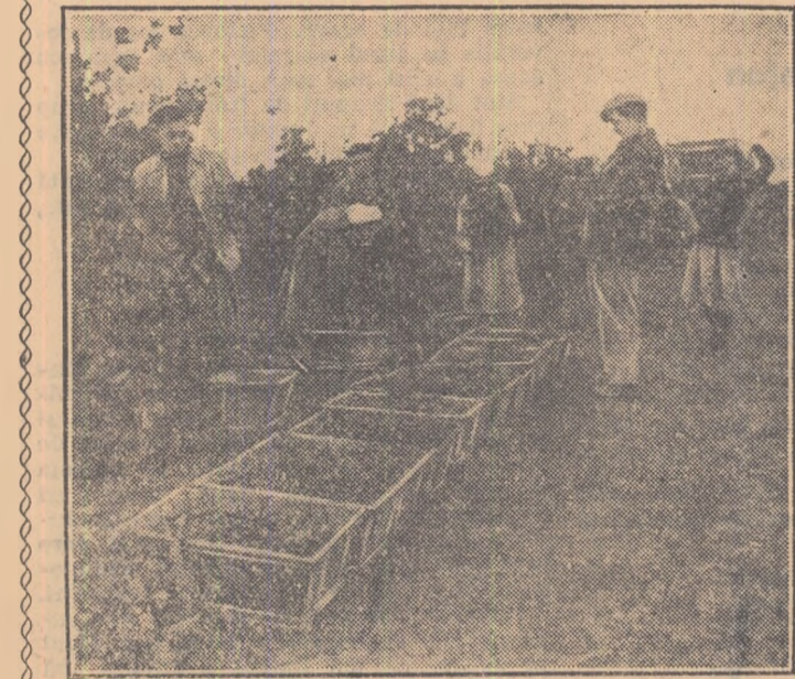
Prin plantările masive de viță de vie ce s-au făcut în ultimii ani, Dobrogea devine o regiune cu un pronunțat caracter viticol. Gospodăriile de stat și cele colective dau astăzi o mare atenție extinderii viței de vie. Cele mai veselte centre viticole ale regiunii sînt Ostrovul, Murfalăru și Poarta Albă. Pe colinele domoale dobrogene cu soare arzător, a crescut anul acesta o recoltă bogată de struguri. Pe lângă ce îndestulează piețele orașelor noastre, strugurii constituie o importanță marfă de export. Din planul de 40.000

Mașina a fost experimentată, iar rezultatele obținute dovedesc că, pe lîngă economiile mari pe care le aduce, mașina asigură uscare completă a cerealelor și înlăturarea în întregime a corpurilor străine. Mașina este acționată de un motor electric. Ea a fost executată în trei zile — timp record — din inițiativa inginerului Suszler Emeric, șeful secției mecanice, cu ajutorul colectivului secției.