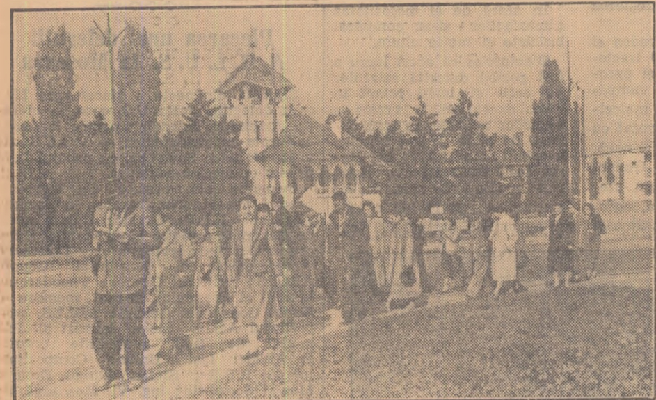
Turisti sovietici care au sosit vineri în Capitala patriei noastre au vizitat Muzeul Minovici. (Foto: Agerpres)

Seara, activiști ai cercurilor A.R.L.U.S. din Capitală și numeroși fruntași în muncă, au luat parte la un concert al Ansamblului de Estradă care a avut loc la Casa Prieteniei Romino-Sovietice A.R.L.U.S. A urmat o reuniune tovarășească. (Agerpres)