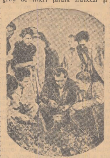
Italienii (pe care-i vedem în această fotografie) ne-au vizitat țara, timp de 20 de zile.

● În toamna anului 1954, un grup de tineri țărani francezi și