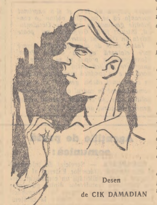
Desen de CIK DAMADIAN