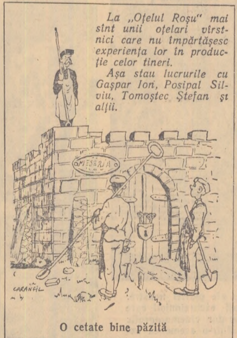
O cetate bine păzită

De curînd, la oțelăria „Siemens-Martin” a uzinelor „Oțelul Roșu” a luat ființă un post utemist de control, care își va îndrepta atenția spre rezolvarea celor mai importante cerințe ale activității în producția de tineri oțelari. El va fi desigur un ajutor de nădejde în munca zilnică a oțelărilor, pentru îndeplinirea angajamentelor pe care le-a luat colectivul secției în cinstea celui de-al II-lea Congres al P.M.R.